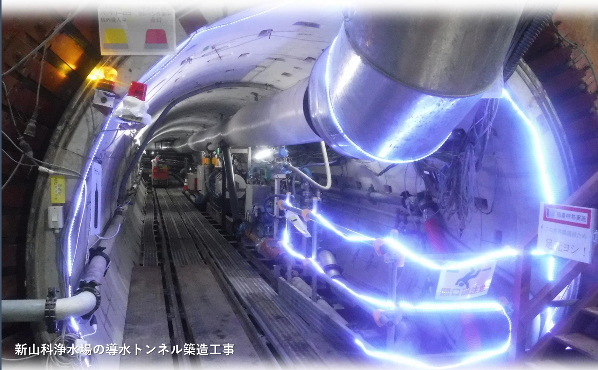
新山科浄水場の導水トンネル築造工事

京都市最大の浄水場である新山科浄水場。大規模シールド工事や浄水処理工程など、市民生活を支える水道事業における技術現場を見学します。